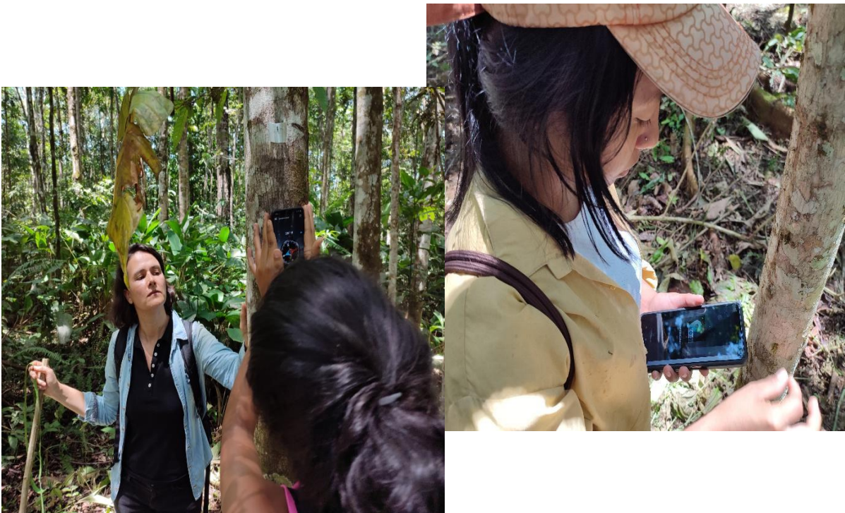
Fotografía 15-16. Tomando coordenadas de ubicación de los árboles