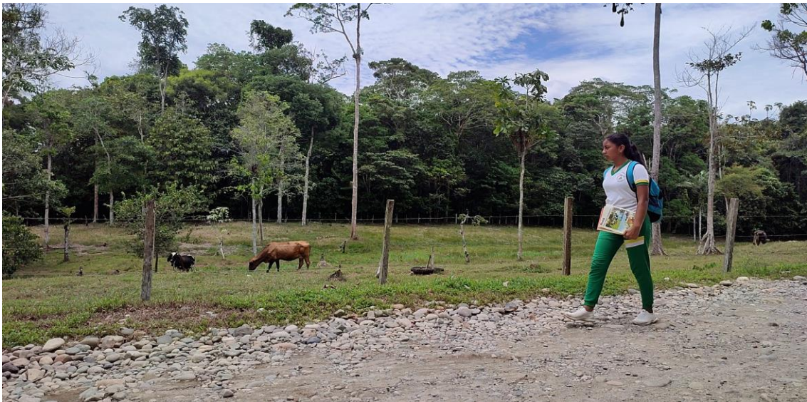
Fotografía 2. La directora. https://youtu.be/gjY-aQxdVYA

La directora invita a reconocer y reflexionar sobre nuestra actitud frente a un grave daño ambiental que causamos a diario sin advertirlo.