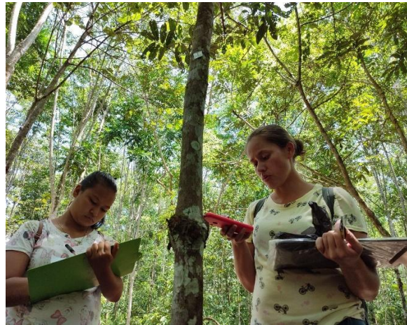
Fotografía 20. Registrando datos