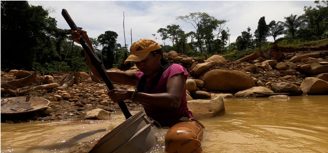
Fotografía 1. La barequera. https://youtu.be/-nBggZg-rkl

Cuenta la historia de una joven madre que busca en la minería su sustento diario y la posibilidad fortuita de materializar sus sueños, pero se encuentra con una alternativa condenada por el Estado y la sociedad.