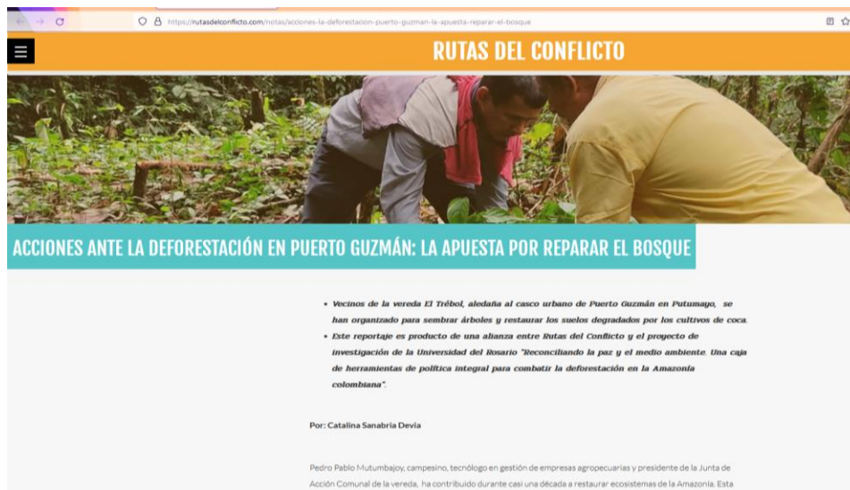
Ilustración 3. El reportaje. https://acortar.link/LKDQZo

Sobre esta investigación se publicó el reportaje, “ACCIONES ANTE LA DEFORESTACIÓN EN PUERTO GUZMÁN: LA APUESTA POR REPARAR EL BOSQUE” publicado en la sesión de HISTORIAS/NOTAS de RUTAS DEL CONFLICTO por Catalina Sanabria Devia.