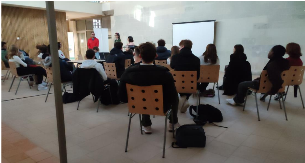
Fotografía 3. Sesión de sensibilización con estudiantes de liceos.

Dos estudiantes guzmanences, con el patrocinio de SelvaViva, se sumaron en noviembre a esta pedagogía. Viajaron a Rennes-Francia y presentaron los sonovisos creados en el primer ciclo, en varias instituciones de la ciudad.