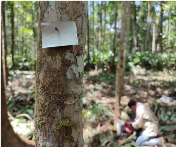
Fotografía 19. Etiquetando árbol