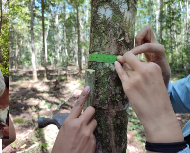
Fotografía 18. Midiendo grosor