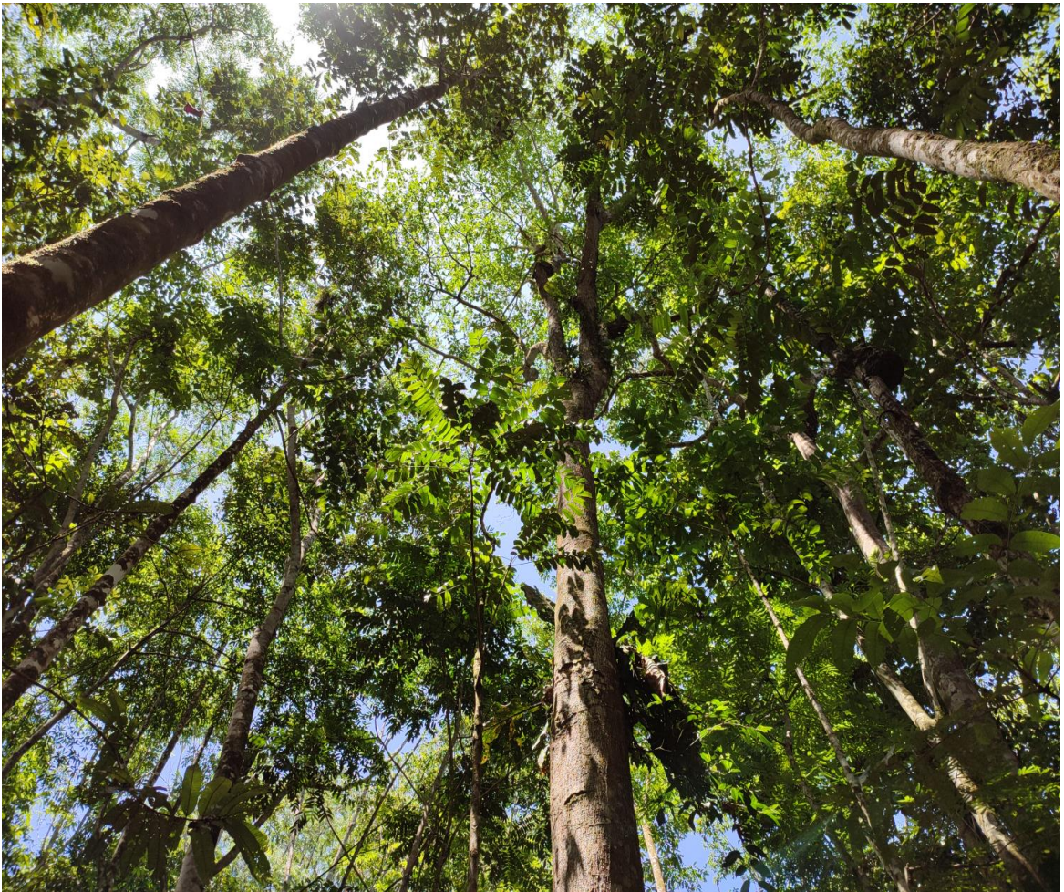
Fotografía 12. Plantación de árboles maderables después de 10 años de su siembra en La Sinita en un área de antiguos potreros.

Esta actividad consistió en la medición de biomasa y carbono secuestrado, a aproximadamente 700 árboles maderables nativos cultivados desde 2012, en 2 parcelas de la plantación La Sinita los días 5 y 12 de noviembre de 2022.