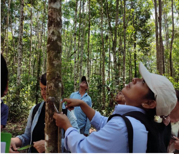
Fotografía 17. Calculando altura